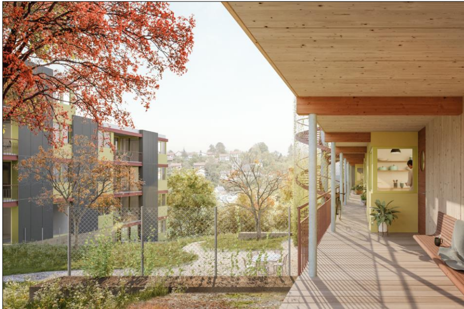
Abbildung 2: Visualisierung Wohngebäude des Siegerprojektes «GRIP» von «Haerle Hubacher Architekten GmbH, Zürich»

Das Projekt erfüllt die Anforderungen der «Richtlinie Energie und Bauökologie» des Stadtrats. Die Neubauten sollen als Holzbauten erstellt werden und die Wärmeerzeugung ist zu 100 % mittels erneuerbarer Energie und einer Photovoltaik-Anlage geplant. Die Freiraumgestaltung schafft Orte für Begegnung und Aufenthalt und berücksichtigt wichtige Aspekte der Ökologie und Biodiversität.