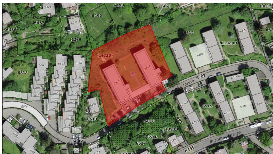
Abbildung 1: Luftbild der Parzelle GB 6514 an der Furkastrasse

Die Logis Suisse ist auf der Parzelle GB Nr. 6514 an der Furkastrasse 18 und 20 Baurechtsnehmerin der Stadt. Auf dem Grundstück befinden sich zwei Mehrfamilienhäuser mit 36 Wohnungen.